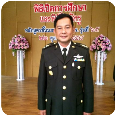
พ.ท.ชิตติสร อจ.รร.สร.